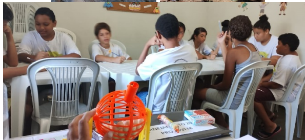
Grupo 3 e 4: Usuários - 18 a 59 anos e Acima de 60 anos